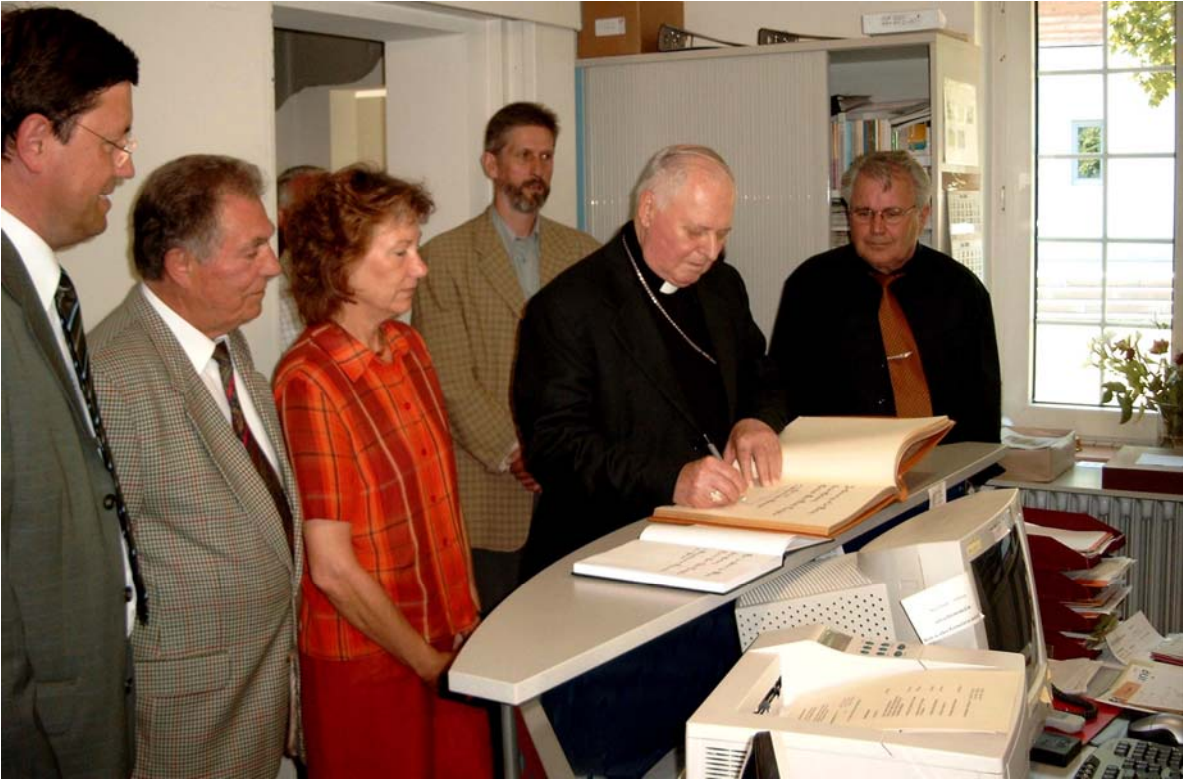
Kardinal Dom Alosio Lorscheider beim Besuch und Eintrag ins Gästebuch des Heimatmuseums Hermeskeil im Jahre 2003. Foto Helmut Schuh.